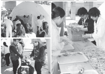
医療スタッフなど総勢106人が参加した防災訓練