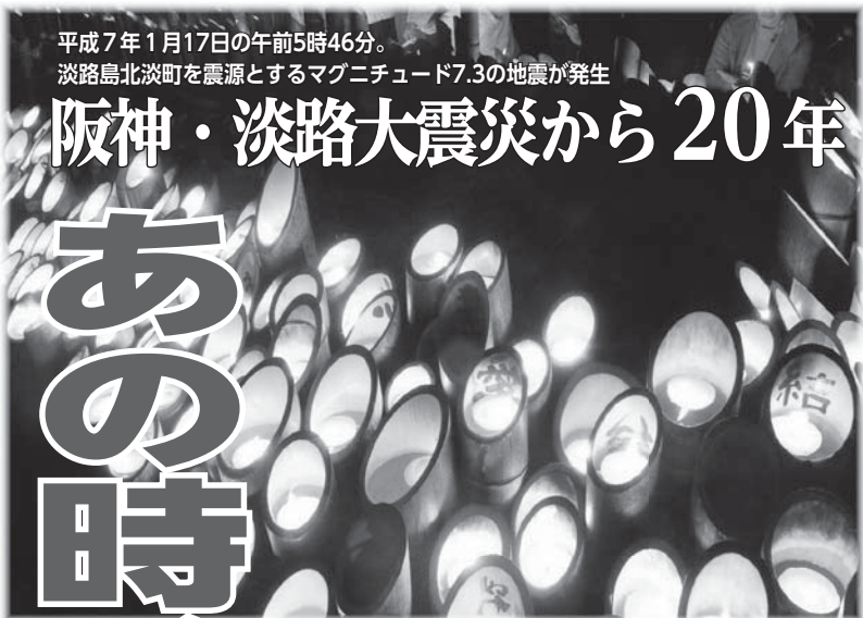
平成7年1月17日の午前5時46分。淡路島北淡町を震源とするマグニチュード7.3の地震が発生

「子どもさんの生きた証を新聞で残してあげたい」と必死でお願いしました。遺族から罵声を浴びせられることもありましたが、当たり前です。つらい思いをしながら生きていく遺族に、亡くなった子ども