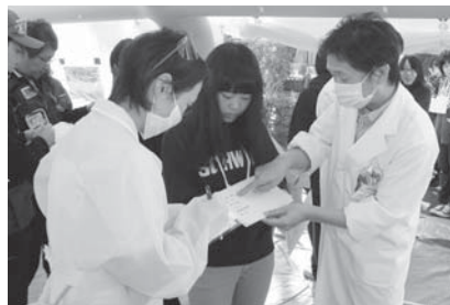
負傷者役として市立看護専門学校の学生も参加