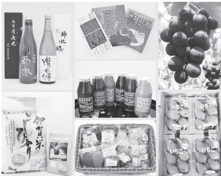
「ふるさと納税」のお礼としてお届けする名張の特産品の一例

振込用紙を送付します。金融機関などで振り込みください。 ※クレジットカード決済、現金書留可