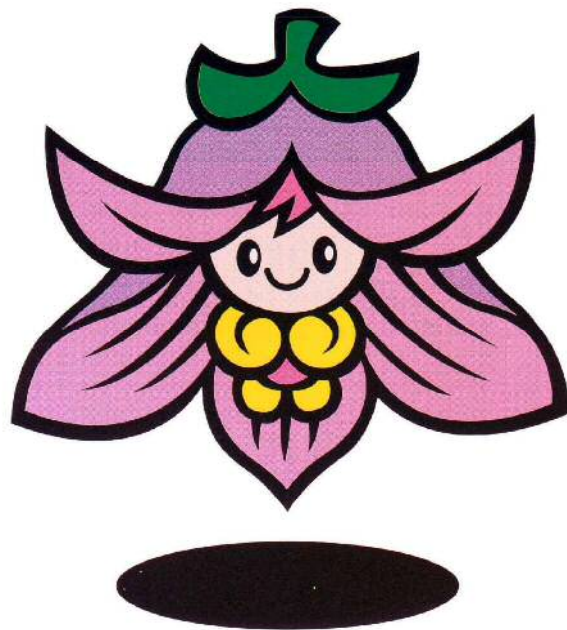
なばりのナッキー