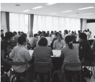
さまざまな職種の人が集まって開催された縁活カフェの様子

在宅医療・介護を受ける人たちが、生まれ育った「まち」に暮らし続けられるようにと企画し、人と人との縁や顔の見える関係づくりで、お互いに応援・支援し合える信頼関係を築くことを目的とした。参加者の満足度は88%に達し、サービス利用者のためにもなるとの意見が大半であった。次回は11月を予定している。