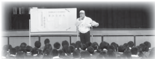
4月9日行われた自転車運転の安全指導(名張中学校)

また、平成25年の死者数4人のうち3人は、高齢者(65歳以上)となっています。年齢に伴い身体機能が変化します。十分な注意と、ゆとりある行動をお願いします。