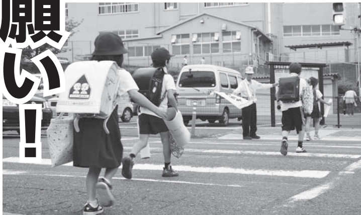
朝の交通安全指導の中、登校する児童(旧名張消防署跡地前)

こうした活動と共に、さまざまな研修会などに参加し、委員相互の安全知識を深めています。そして、警察や交通安全協会など関係機関と連携を図り、交通事故を撲滅できるように取り組んでいます。