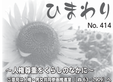
～人権尊重をくらしのなかに～ 意見は人権・男女共同参画推進室 (☎63・7909)へ

また、歌以外にも私を元気にさせてくれる事があります。それは職場からの帰り道沿いの畑で出会う人の姿です。七十歳は過ぎてい