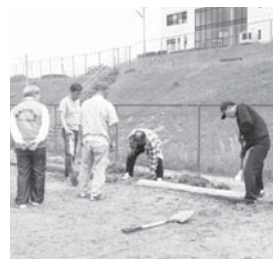
車止めなどを手作りし、駐車場整備

迷惑駐車の問題では、メイン道路の迷惑駐車を減少させることを目的に、団地開発事業者や商店街の皆さんと話し合いを持ちました。その結果、スパー隣にある