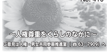
～人権尊重をくらしのなかに～ 意見は人権・男女共同参画推進室(☎63-7909)へ

数日後、駅に向かって歩いていたら、走ってきた小学校低学年くらいの女の子とぶつかった。はすみで、わたしの荷物が道路に散乱してしまいました。「危ないなあ」と少し腹立たしく感じながら荷物を拾おうとすると、男の子が「おじさん、ごめんなさい!」と言い、散らばった荷物を手早く拾い集め出してくれたのです。「この子にもわたしの腹立ちは伝わってしまっただろうな、戸惑いや恐怖感もあるだろうな」そう考えながら、散らばった荷物を拾い集めてくれていた男の子の姿を見ていると、腹立たしさを感じた自分に対する