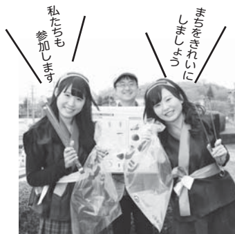
ご当地アイドル「縁夢寿美ガールズ」の皆さんも名張川河川敷を清掃します

ひとりの力は小さくても、地域や仲間が集まって活動することで大きな効果が期待できます。住む人も訪れる人も気持ちよく過ごせるまちにするため、ぜひ皆さんも清掃美化活動にご参加ください。