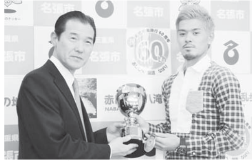
▲東アジアカップ優勝&MVP獲得報告来庁時に撮影(平成25年11月)

平成2年生まれ。矢川出身。セレッソ大阪所属のプロサッカー選手。各世代別の日本代表にも選ばれ、平成24年開催のロンドンオリンピックでは、全試合フル出場し、チームのベスト4進出に貢献。フル代表初選出となった東アジアカップでは、全試合出場し優勝に貢献、MVPも獲得した。