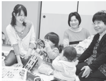
「マアヤにここ広場」(妙典寺会館/元町)

「子育てに少なからず不安を感じています。こうした広場で、子育てするママさん同士が交流したり、私たち主任児童委員などと相談したりすることで、育児の不安を解消し、安心して子育てにあたってほしいですね」と話します。