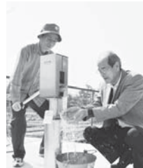
簡易ポンプを備えた防災井戸

具体的には、地元産野菜を井戸水で洗ひ、この防災井戸のまわりで朝市を開催。そして、集まってくる皆さんとおしゃべりを交えながら、蔵持にある歴史・文化を発信する仕掛けづくりを考えています。皆さんが楽しめる場を作りたと思います。