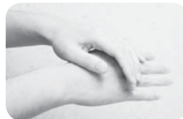
②両手の甲もこすり洗いする