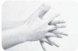
④両指の重ねてこすり合わせ、指の間を洗う