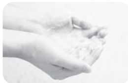
①せっけんを泡立て、手のひらどうしをよくこすり合わせる

手洗いの仕方 せっけんやハンドソープで30秒以上洗うことでウイルスを洗い流します。