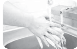
⑥流水で洗い流す。水分は十分ふき取ってください。