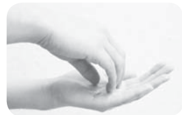
③指先、爪の間も念入りに