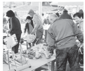
地元産とれたての野菜を販売する朝市

給食に地元産食材を提供したり、食育を通じて地域の歴史を伝えたりするなど、積極的な取り組みを進めています。このような活動が、地域の活性化や地域高齢者の生きがいづくりにつながっていると 생각합니다。「朝市後のみんなのおしゃべり」や「作ったものを喜んでもらえること」が、私たちの元気の源です。