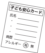
子ども安心カード

学校現場の取り組み状況を詳しく把握し、是正やチェック体制の見直しで、指導体制の強化を図る。緊急時の対応として「子ども安心カード」を作成することで、迅速かつ効率化が図られるかを学校教職員と協議し、消防と連携しながら検討する。