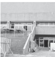
改修中の総合体育館

公共施設の老朽化・更新は、今後の財政運営を行うためには、極めて重要なことと考えている。将来を見据えた、中長期的かつ横断的な視点に立った公共施設マネジメントの展開を明らかにしていきたい。そのためには、全庁的に取り組む組織体制を構築し、一定の手法で公共施設の調査を行う。現状を把握した上で、全体最適化を目指して早期実現に向けて取り組む。