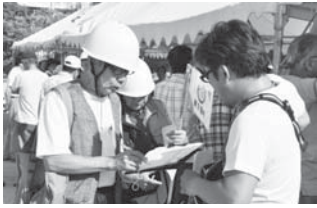
避難訓練当日の様子

これまでのような防災関係機関・団体が集結した展示型ではなく、市全体が初期の対応について、市民・地域・市など、各々が訓練を行い、15地域がテーマに沿って取り組み、相互に実践的な連携を図る。地域の検討の場に同席し、共に協議を行い、今回の訓練が実効性の高いものになるよう努めていく。