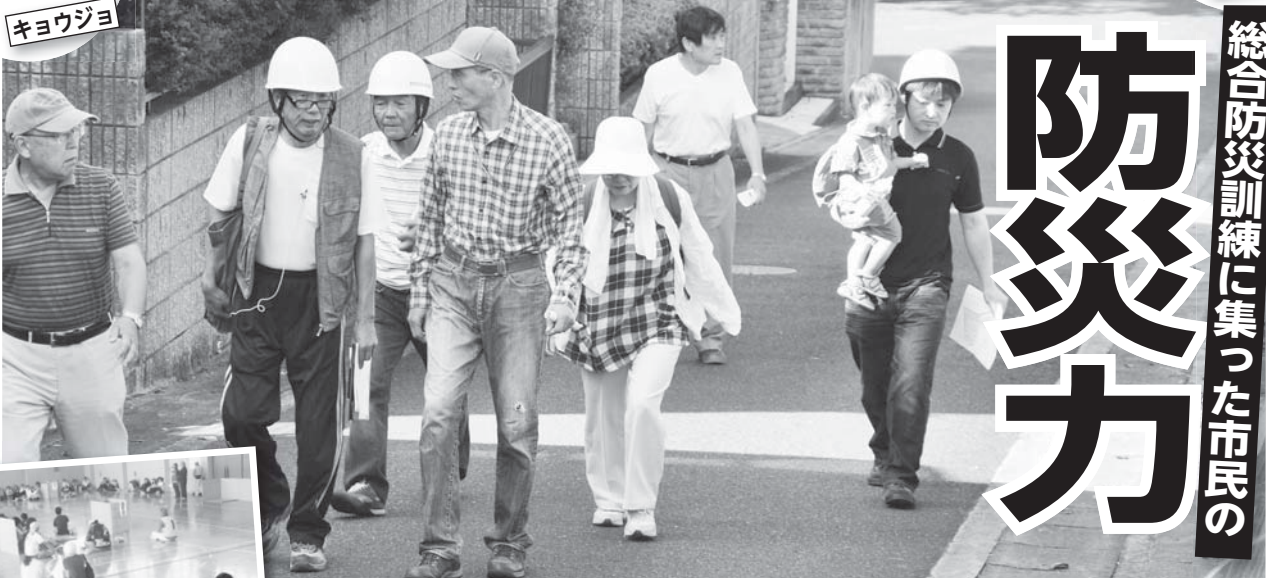
一時避難場所へ避難する地域の皆さん