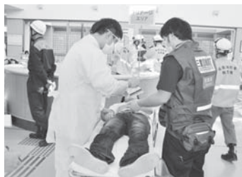
災害拠点病院(市立病院)では、搬送された重篤患者の二次トリアージ(*)を実施