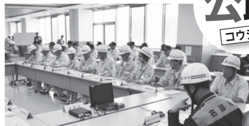
市防災センターに災害対策本部を設置。情報収集や防災関係機関との調整を実施