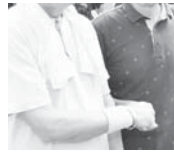
青蓮寺・百合が丘地域の災害時要援護者は、黄色のバンドをつけ訓練に参加