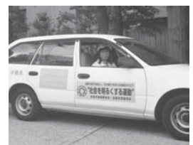
啓発に出發する公用車