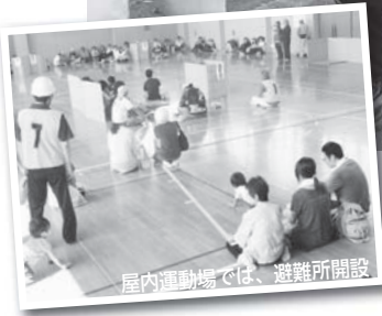
屋内運動場では、避難所開設

大規模災害時には、公的機関による支援が行き届かない可能性があります。まずは、自分の身は自分で守ること。そして、今回の訓練のように、地域の皆さんが担った一時避難場所での活動、災害時要援護者の支援などが災害初動時には、特に重要となります。 今回の訓練を受け、各地域から出た課題を検証し、今後の防災活動につなげていきます。また、検証がまとまり次第、市ホームページなどに掲載します。 いつ起きるか分からない災害に備え、まずは、自分の身は自分で守る「自助」、そして地域での助け合い「共助」と公的機関による支援「公助」の連携を深められるよう、今後も防災意識を高める取り組みを進めます。