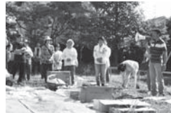
一時避難場所に集まり安否確認などを実施