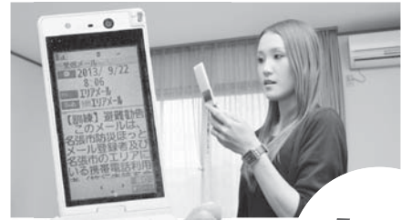
「[訓練] 避難勧告」をエリアメール・緊急速報メールで受信