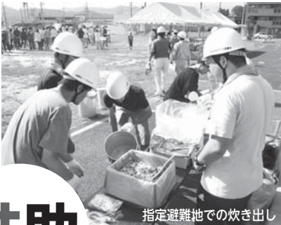
指定避難地での炊き出し

発行/名張市企画財政部広報対話室 〒518-0492 名張市鴻之台1-1 ☎0595-63-7402 ✉pr@city.nabari.mie.jp ㊚http://www.city.nabari.lg.jp