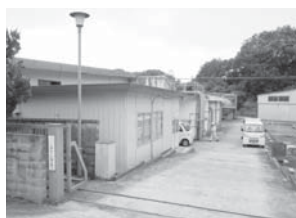
つつじが丘コミュニティプラント

中央処理区の住宅団地の汚水処理施設の移管については、4カ所を接続移管しており、残りの住宅団地の汚水施設も順次移管していく。一方、南部処理区の住宅団地の公共管理への移管については、住宅団地の施設所有者、管理組合、自治会役員と移管方針に基づき条件整備の協議を平成25年度から行っており、移管条件の整った団地から26年度より公共管理していく。