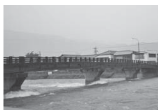
増水時の名張川(鍛冶町橋)

名張川の改修事業については、今後も木津川上流直轄改修促進期合同盟会を通じ要望していく。市管轄の排水設備については、計画的に整備し、被害を回避するための短期的な対応として、局部改良も検討している。