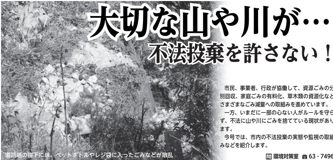
道路端の崖下には、ペットボトルやレジ袋に入ったごみなどが散乱

発行/名張市企画財政部広報対話室 〒518-0492 名張市鴻之台1-1 ☎0595-63-7402 ✉pr@city.nabari.mie.jp ㊚http://www.city.nabari.lg.jp