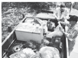
回収した不法投棄物

美観を損なわないよう、地域でもしっかり目を光らせながら、名張の美しい自然を守っていきます。また多くの観光客の皆さんに、気持ちよく楽しんでいただきたいと思ひます。