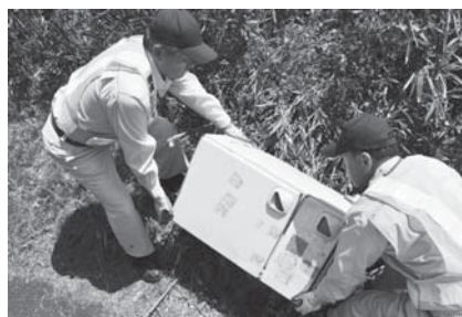
不法投棄された冷蔵庫を運ぶ環境レンジャー