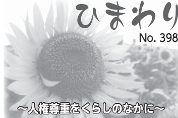
～人権尊重をくらしのなか～ 意見は人権・男女共同参画推進室(☎63-7909)へ