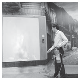
▲画面の炎に向け消火体験