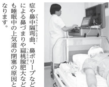
症や鼻中隔彎曲、鼻ポリープなどによる鼻つまりや扁桃腺肥大なども睡眠中の上気道の閉塞の原因となります。

よりも閉塞性睡眠時無呼吸症候群になりやすいと考えられ、顎が小さいの顔立ちであればさらに睡眠中に上気道が閉塞しやすいと言われています。よって、閉塞性睡眠時無呼吸症候群は肥満に合併することが多いのですが、肥満がなくとも完全に睡眠時無呼吸症候群を否定することはできません。花粉