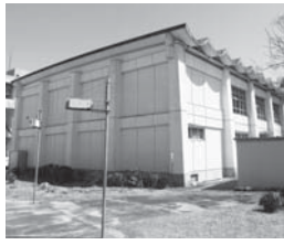
耐震補強工事予定の薦原小体育館

南海トラフを震源とする地震が近いうちに起きると予測されるなか、小・中学校の耐震化が完了していない。国の「地震防災対策特別法」が改正され、耐震化事業に対する国庫補助金のかさ上げ措置が、平成28年3月31日まで延長された。24年度補正予算でも、学校の老朽化改修と耐震化への補助がある。これらを利用して、子どもたちの安全を守るため、早期の耐震化完了を求める。