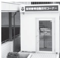
自動交付機 (名張駅東口)

市内3カ所に自動交付機を設置し、午前7時から午後10時まで各種証明書が取得でき、市民の利便性を図っている。27年度に自動交付機の更新時期を迎えるため、国の社会保障と番号制度の動向も含め費用対効果を検証し、導入に向け検討する。