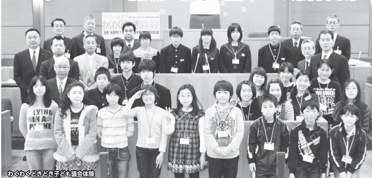
わくわくどきどき子ども議会体験