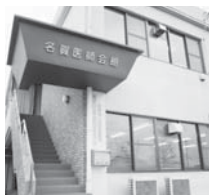
在宅医療支援センターがある名賀医師会館

平成23年4月「名張市在宅医療支援センター」を設置し、在宅療養を推進している。今後も訪問医や介護士などの連携を密にし、さらに充実させる。名張市立病院も非輪番日の受け入れを検討し連携を図る。