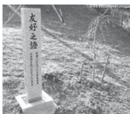
ユネスコ協会姉妹提携記念碑

水原市は人口119万人で、歴史と伝統があり先端技術を担う企業も多い。市にとって有益であり、市制60周年を迎える来年度に締結したい。