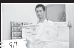
洪水・土砂災害の危険箇所の最新予測や防災関連施設などを示した「ハザードマップ」を配布しました。