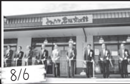
温浴施設「名張の湯」に併設して、地場産品の販売や地域福祉の交流の場「とれたて名張交流館」がオープン。10月1日には両施設が、「まちの駅なばり」に認定されました。