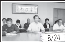
地域の人々や関係機関が連携して、高齢者など行方不明者の早期発見・保護につなげる「地域SOSシステム」を立ち上げました。