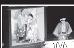
創作乱歩狂言「押絵と旅する男 2012」を宮城県塩竈市で開催。名張市(9月)、豊島区(12月)でも開催し、能楽のふるさと名張を発信しました。