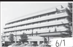
市立病院が、「地域医療支援病院」に承認されました。また、昨年と比べ常勤医師が6人増となりました。