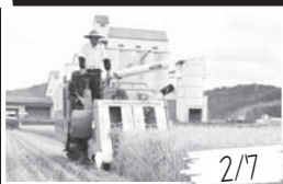
平成23年産「伊賀米コシヒカリ」が、米の食味ランキングで、初めて最高評価「特A」に選ばれました。