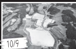
借入金利息などによる市政への深刻な影響や工業団地事業の完了などから「土地開発公社」を解散しました。