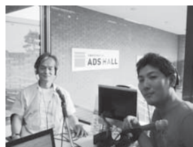
FMラジオで呼びかける中内会長(左)