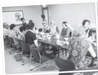
錦生地域で採れた野菜を使った料理などを部会で検討

今後は錦生特産品「錦生ブランド」を創設し、全国へ発信して行けるよう、生産会員の募集と地域住民の協力を要請していきます。また、身近な野菜のレシピや季節の野菜料理教室なども行っていきます。