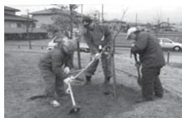
花いっぱい運動、桜の植樹など地域で行う公園整備事業