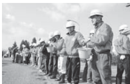
地域での防災啓発、防災備品整備などの事業