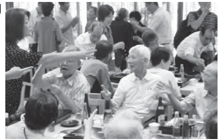
敬老のつどいでは、まちの保健室の協力で、血圧測定や健康指導も実施した。