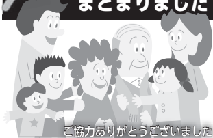
ご協力ありがとうございました