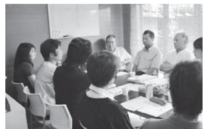
関係機関との勉強会。今後のサービス充実について検討

「名張地区地域ビジョンに掲げる5つの柱の一つに「人と人が支え合い楽しく暮らせるまちづくり」があります。その中の事業として、有償ボランティアの生活支援サービス「隠おたがいさん」を今年4月から本格スタートさせました。照明器具の取替えや蛇口の取替え、布団干し、庭の草引きなど日常生活の困りごとに対し、地域が支え、依頼に応じています。地区の中心にある一つの空き家を「隠おたがいさん」の事務所としています。