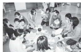
子育て広場の新設

◎ 3～5ページでは、「地域発信！ふるさと便」として各地域づくり組織からの活動状況などをお知らせします。今回は6地域をご紹介します、次回は、来年3月ごろに9地域からの情報をお届けする予定です。お楽しみに！