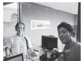
FMラジオで呼びかける中内会長(左)