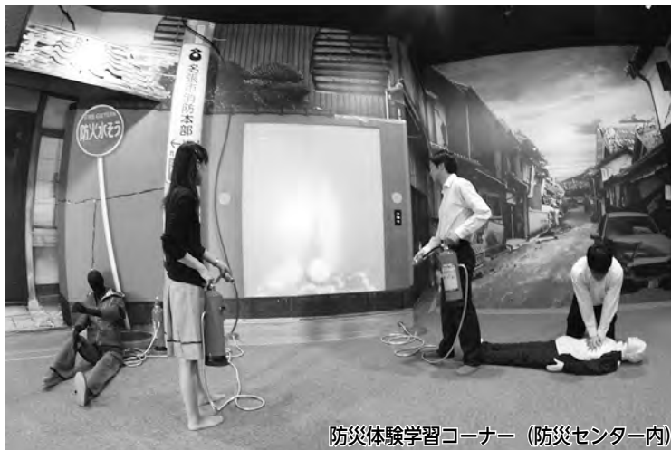
防災体験学習コーナー (防災センター内)

市民の皆さんが、安全で安心して暮らせる災害に強いまちづくりをしっかりと進めていくための新消防庁舎が完成しました。6月21日に消防署が移転し、7月1日には、防災センターが庁舎内にオープンします。