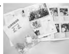
◀給食ボランティアグループ「友・友」の皆さん

「しあわせ川柳」入選句紹介 ・るるると ちいさいあしが たのしそう (13歳 女性) ・夕食時 一家団樂 笑い声 (78歳 男性) ・出無精の 私を招く このサロン (84歳 女性)