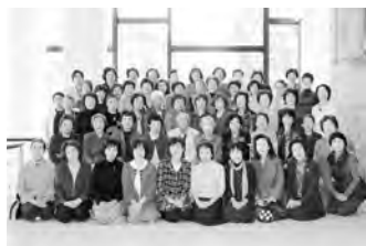
◀給食ボランティアグループ「友・友」の皆さん

して、自分たちの活動の必要性を確認しました。また、今後も笑顔で元気に地域のため、自分のために、30周年を目指して頑張ろうと心をひとつにしました。 「友・友」の先駆的な活動がきっかけとなり、現在、市内8地域で9グループが給食ボランティアの活動をされています。