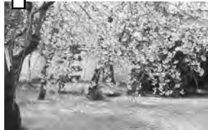
⑦ 名張藤堂家邸 ♀ ふれあい