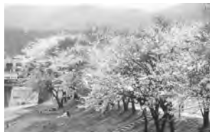
⑧ 名張川堤 ♀ 新町口

「ナッキー号」(市街地循環型コミュニティバス)を利用して楽しめる名張の桜をご紹介します。