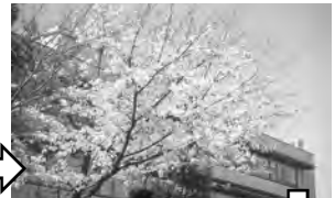
③ 名張市役所 ♀ 名張市役所