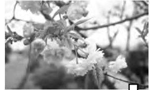
④ 桔梗が丘1番町 ♀ 桔梗が丘駅前