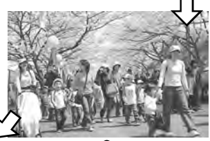
⑤ 中央公園 ♀ 総合体育館

ここが桜まつりの会場です。体育施設が集まる中央公園には、ソメイヨシノ約750本が咲き誇ります。