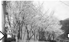
② 名張公民館 ♀ 松崎町