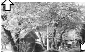
⑥ 桜ヶ丘 ♀ 図書館