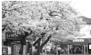
① 近鉄名張駅西口 ♀ 名張駅西口