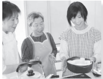
◀市民活動団体の柔軟性や独創性を生かし企業と共同で開催した講座では、ハーブを使ったケーキづくりも。園芸福祉の活動内容は幅広い!

★市ホームページ「ホームページから探す」・「まちづくり」から、事業の詳細をご覧ください。