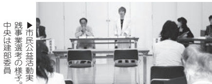
▶市民公益活動実践事業選考の様子。中央は選考委員

対象 市内在住または在学、在勤、市民活動に関心のある18歳以上の人で、年4回程度の会議に出席できる人 ※市民公益活動団体関係者委員は、市内のボランティア団体や市民活動団体に所属し活動している人が対象 募集人数 いずれも2人以内 任期 2年 申込期限 3月1日(日) ◎詳しくは、地域経営室(☎63-7484)へ