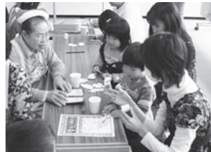
▲トコトコ人形作り

パーティーでは「チームふたば」によるトーンチャイム演奏や小児救急ボランティア「ママナースの歩」による手洗いについての話のほか、紙コップでトコトコ人形を作って遊んだり、「ふれあい隊」のお姉さんと一緒に遊んだり・・・親子で楽しく、クリスマス気分を満喫しました。