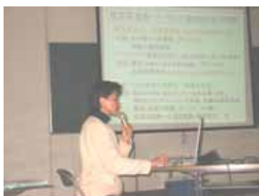
事務局からの説明